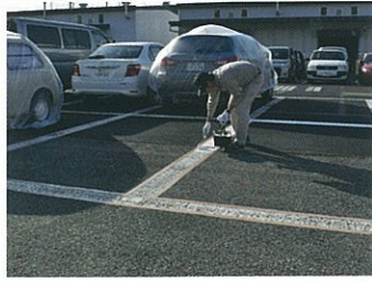
水性ハードラインをローラーにたっぷりつけて上塗りします。乾燥後、2回目の上塗りをします（含ませる量は1回目より少なめにしてください）。