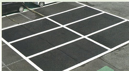
この通り！ ※ラインにはW-100、駐車面は水性パーキングブラックを施工しています。