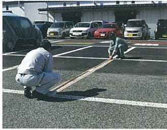
ゴミやホコリをきれいに取り除いた後、基準線に沿って布粘着テープでマスキングします。