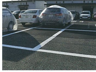
かすれたラインもきれいに蘇りました。